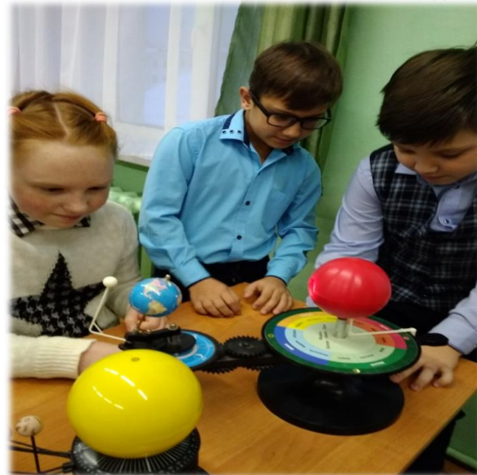
Влияние лунных фаз на успеваемость учащихся.