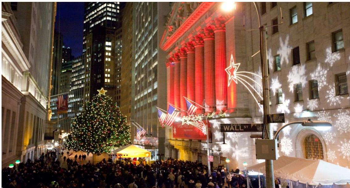
Streets of New York during Christmas

Before Christmas, kids across America listen to Clement Moore's amazing poem “The Night Before Christmas”. No wonder they say that Christmas is the day when everyone believes in magic and miracle.