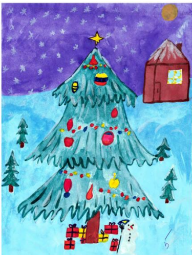
Рисунок: Ленов Илья, 5 «Г»

Волопас взял маму за руку, и они пошли в другую комнату, а Малая медведица побежала за ними. Мальчик лёг в кровать и Большая медведица накрыла его одеялом. Малая медведица легла в ногах Волопаса, согревая их. Рядом с кроватью стояла небольшая ёлочка. Пусть она и не блестела как звёзды, но была очень красива. На ней висели конфетки, яблочки, пряники, шишки и игрушки. Больше всего привлекали внимание олень, стоящий на самой верхушке, и не только потому что он был выше всех. Олень сиял будто бриллиант и переливался разными красками.