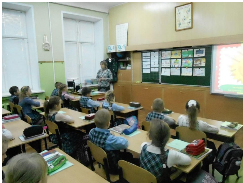
Ученики младшего класса узнают о своих правах